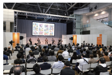
企画セッションオープンステージ