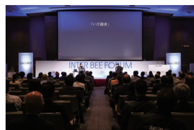
INTER BEE FORUM 会場風景