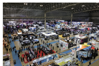
展示会場鳥瞰（一部）